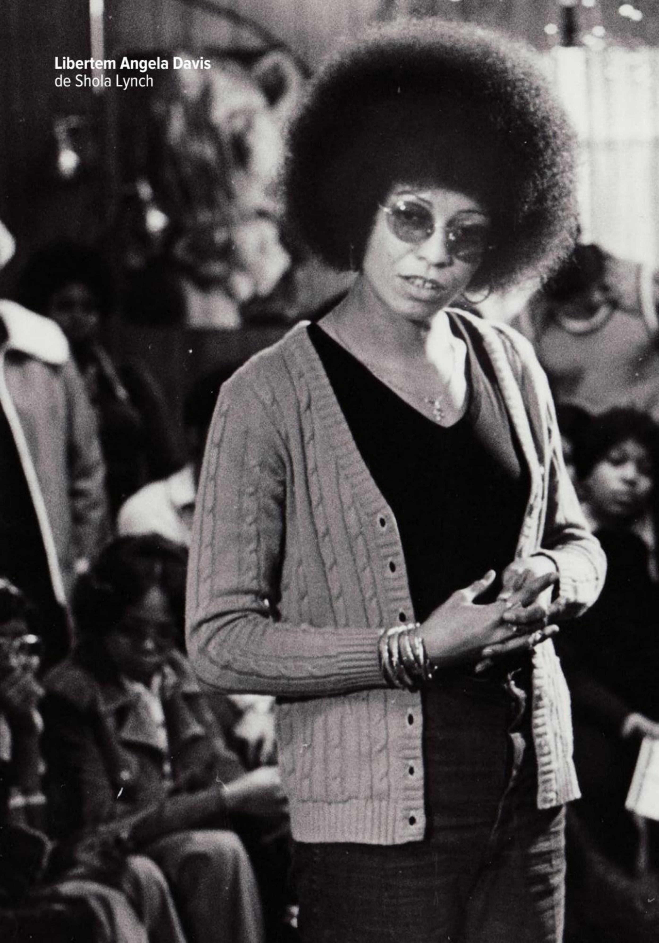
Libertem Angela Davis de Shola Lynch